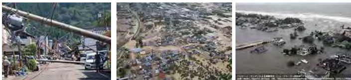
暴風による倒壊 豪雨による水害 高潮災害