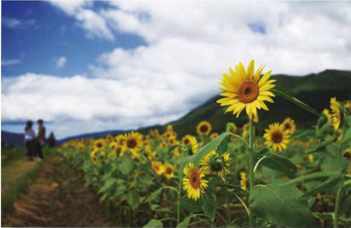
(撮影場所・南阿蘇村)