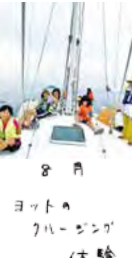
8月 ヨットのハーブング体験