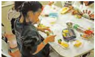
12月 おせち料理作り