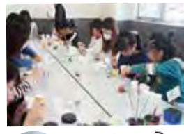
11月 カラースンドアート体験