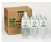
非常食と水分保存