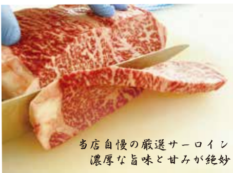
当店自慢の厳選サーロイン 濃厚な旨味と甘みが絶妙

が並んでいて、お客様のご要望に合わせたカットもおこなっている。サーロインをはじめ、あまり見る事のない大きな肉の塊や珍しい物も取り扱っている。どの肉がいいか...。そんな時は、スタッフに声をかけていただくと、おススメや用途に合った品物を教えてくれるそうだ。