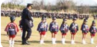
▲やすらぎ保育園幼年消防クラブ