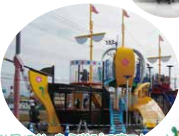
4月になつたら遊びに来てね~♪

しげんゴミは及しゃるいに分るいされ、新しいしげんとして活用されています。八代市はこれまで処理できなかつたゴミを、他の県や市にたくしてまいりました。エコエイト八代のかんせい、八代でたゴミすべてを処理できるようになりました。