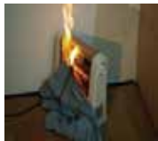
●可燃物(衣類)に注意