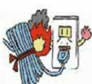
●ジュール熱火災 (束状)