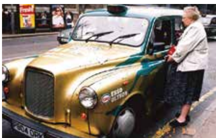
▲ロンドンのタクシーはなんと全てがベンツ

一般庶民が愛用する二階建バスは合理的で、いつべんに多くの乗客を運ぶことが出来ることから始まった。街中のカフェも同じだ。日本風(酒屋)に立ち飲み一杯飲み飲んで家へ帰るのだが、まさし