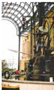
▲グリニッチはイギリス海軍の軍港のある街