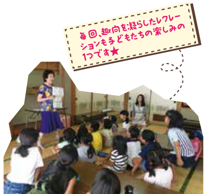
毎回、趣向を凝らしたレクレーションも子どもたちの楽しみの一つです★

やちわっ子広場は、八千把校区民生委員児童委員協議会が運営。平成29・30年度全国民生委員児童委員連合会主催の児童委員強化推進方策モデル事業として平成29年3月27日プレオープンした。仕事が一息ついた方をはじめ、手は貸せないけれども、野菜だけでも使ってほしい...といった方、また企業からの食材提供もあるそうだ。中には栄養士の方もいてパランスの取れたメニューを提案してくれるという。