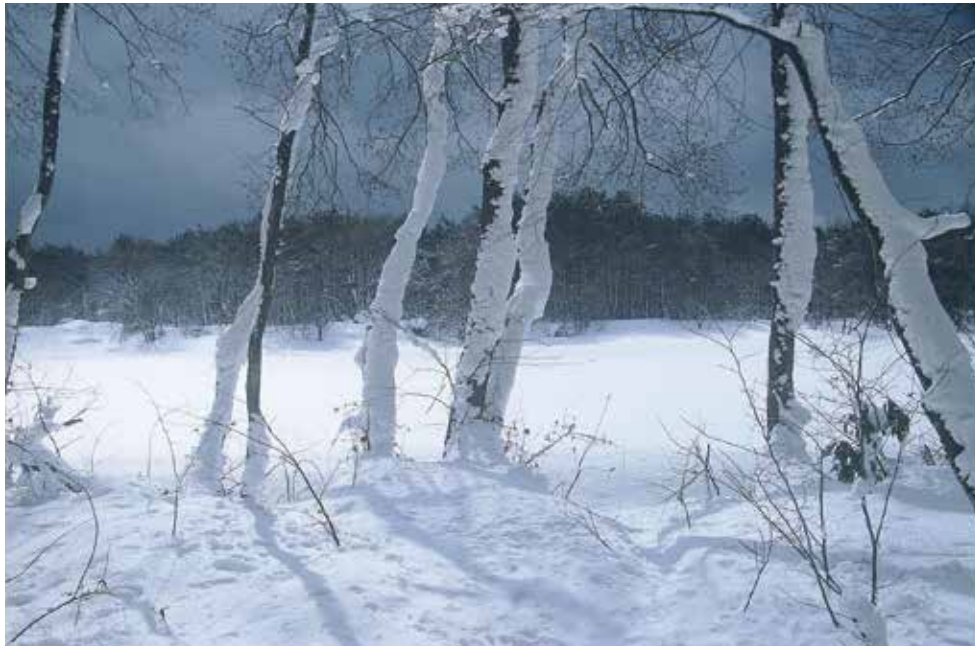
(撮影場所：福島県裏磐梯)