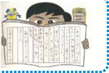
届いたお礼のお手紙の一部