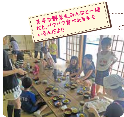
苦手な野菜も、みんなと一緒にだと、パクパク食べれる手もあるんだよ!!

やちわっ子広場は、八千把校区民生委員児童委員協議会が運営。平成29・30年度全国民生委員児童委員連合会主催の児童委員強化推進方策モデル事業として平成29年3月27日プレオープンした。仕事が一息ついた方をはじめ、手は貸せないけれども、野菜だけでも使ってほしい...といった方、また企業からの食材提供もあるそうだ。中には栄養士の方もいてパランスの取れたメニューを提案してくれるという。