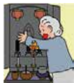
●着衣着火 (ローソク)