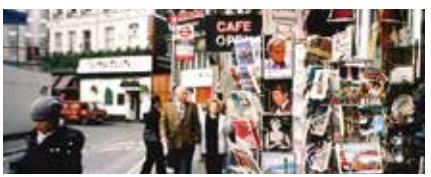
▲ロンドンには歩けばカフェにぶつかると言われるほどカフェがある