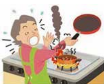
●着衣着火 (ガスコンロ)