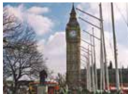
▲時計台の下にチャーチルの銅像が見える