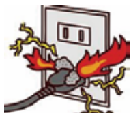
●トラッキング火災 (水分とホコリ)