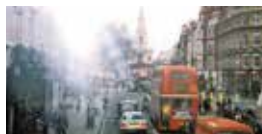
▲霧の町ロンドンといわれるくらいよく霧がかかる

く一杯しか飲まず時間も10分そこそこ、日本のように”軽く一杯”がきっかけではしご酒になり、深夜に家に帰りつくのとは異なる。 世界標準時もイギリスが起点だ。ロンドンから電車で40分