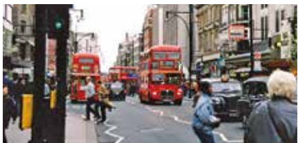
▲イギリスと言えば2階建てバス