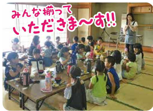
みんな揃っていただきます～す!!

調理中は、一緒に料理をすることもあれば、レクリエーションを取り入れ、バルーンアートや紙芝居、珍しいヨーロッパ系のエスペラント語と言った語学学習など、常に子ども達に喜んでもらうように考えているそうだ。 調理が終わると食事の準備に取り掛かる。これは、子ども達にも手伝ってもらおうというので、皆素早くテキパキとしていて、あつという間に終わる。全員揃ったところで『いただきます!!』 メニューは、その時々で素材で決まる。特に人気だったのは、かぼちゃを揚げたものをトッピングしたカレーだったそうだ。家庭でも真似のしやすい料理で参考にされる方も多いとか。