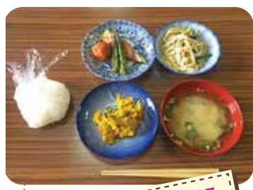
その時々で素材に合わせて栄養士が考えたパランスの取れた献立です★

参加者の中には、「子供が楽しみに通っていました。このようなふれあいの時間、企画を楽しみにしています」や「自分も将来子ども達を笑顔にするような事をしていきたい」と言った感謝の手紙を綴ってくれる方もいて勇気づけられているそうだ。 今後は子どもの居場所づくりとして『子ども食堂』以外の取り組みも考えているとのこと。