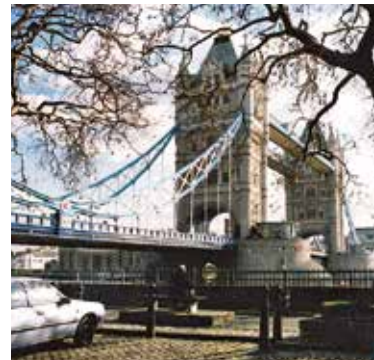
▲ロンドンと言えばロンドンブリッジ「ロンドン橋落ちた」と歌われ日本でも有名な橋。テムズ川にかかる橋

らいの街、グリニッチにあるグリニッチ天文台だ。パリのエッフェル塔は万国博覧会の時に建設されたが、ロンドン、テムズ川にかかるロンドンブリッジはイギリスで開かれた博覧会の時にかかった橋。 東京にある日本道路の原票は日本橋。今や高速道路が上を通り空がほとんど見えず、霧のロンドンより視界が悪くなってしまう。