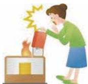
●補給時の危険 (*消火後に)