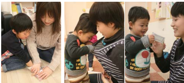
▲アルミホイルで自分の手形をとろう ▲ママ～、おやつはどこ～？ ▲あった～!!