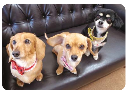
ひなちゃん (9歳・メス) ★ミニチュア・ダックスフンド さくらちゃん (7歳・メス) ★ミックス こはるちゃん (7歳・メス) ★ミックス

ひなは2匹のお母さん。3匹の中で一番の食いしん坊。こはるは少し臆病で、さくらは脱走名犬です。