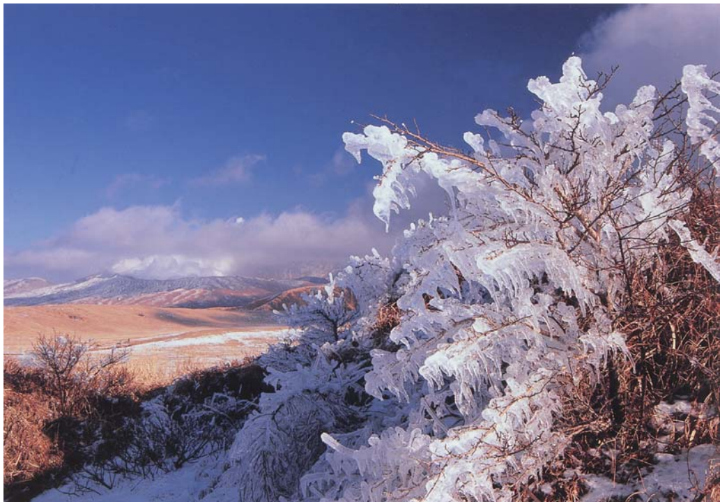
(撮影場所:阿蘇の草千里)