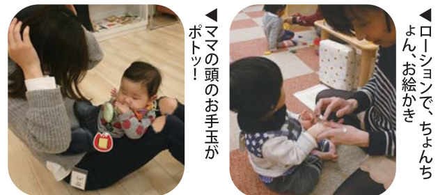
▲ママの頭のお手玉がポトツ！ ▲ローションで、ちよんちよん、お絵かき