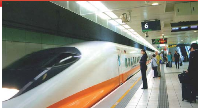
▲台湾を走る新幹線

こんな台湾ですが、外国人旅行者の4割は日本人で、圧倒的に台北が人気ですが、次が台中、3番目が台南(高雄)です。かつて日本は台湾に占領さ