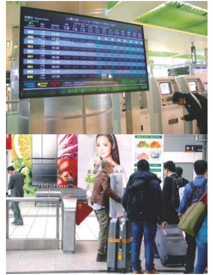
▲外国人旅行者の4割は日本人

本語が話せるし、漢字、ひらがなが読めるので、筆談による会話はかなり有効でした。私が会った台湾人男性は「おはよう」「こんにちは」「こんばんは」「おやすみなさい」の挨拶ことばはもろろんのこと「味噌汁」「タクワン」「豆腐」「つけもの」など次から次に思い出してしゃべってくれました。