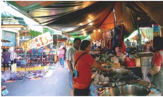
▲ある年代の人たちには日本語が通じる

熊本は高雄と友好関係が結ばれ、熊本と高雄間は週に1便が運行され、3人以上の団体で行けば補助金が出され、3泊4日の気軽な旅行が出来ます。今回、私の場合は熊本空港発の便と日程が合わなかったため、福岡発、新幹線での高雄(正確には新幹線の終着駅・左営まで)へ入ったのですが、今まで10回以上台湾を訪れていますが、台湾語はほとんどしゃべれません。街中に漢字があふれていますが、現地の人は台湾ことばで発音しますのでチップカンポン。反省させられた旅でした。