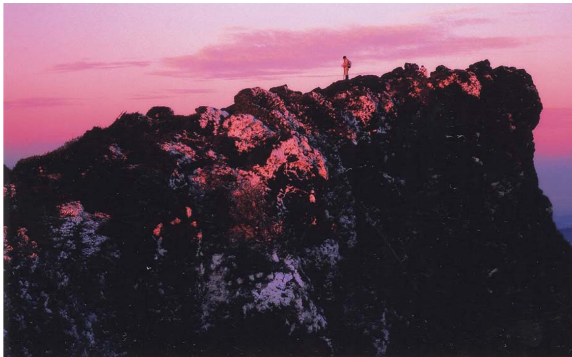
(撮影場所:霧島連山の韓国岳)