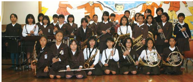
八千把小学校*吹奏楽部