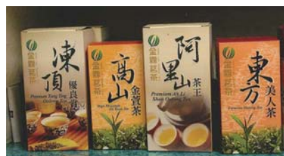
▲お茶屋の店先に並ぶお茶