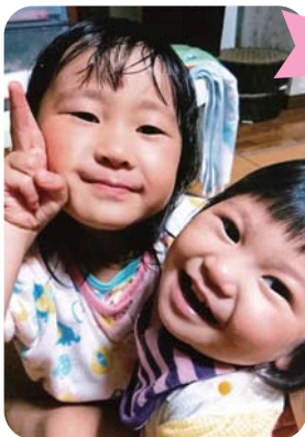
ひいちゃんはおねちゃん、お世話にな ります。元気に長生きしてください。