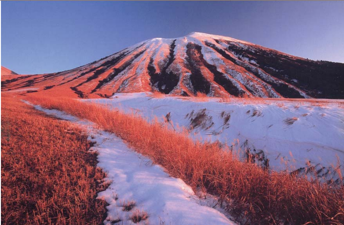
(撮影場所：阿蘇の杵島岳)