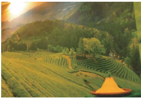
▲台湾の段々畑で作られるお茶

今年旅行客にかなりの変化があった年。外国人の日本訪問客が飛躍的に増えたこと。爆買いとやらで電気製品が買われ、空港で多くの中国人が、大きな商品を何個も買い、旅行カバンは、ものすごい大型のもの。それに何十万円という買い物をし、消費税が出国時にかえってくるというので、その手続きカウンターのところは長蛇の列ができるほど。エスカレーター幅をオーバーする荷物で、必死で倒れないように押さえて持っている姿があちこちで展開された。それも最近では一段落して、この頃は小物雑貨の類に目がいつている。