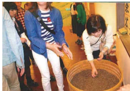
▲出来たてのお茶を手ですくうことも…

今年旅行客にかなりの変化があった年。外国人の日本訪問客が飛躍的に増えたこと。爆買いとやらで電気製品が買われ、空港で多くの中国人が、大きな商品を何個も買い、旅行カバンは、ものすごい大型のもの。それに何十万円という買い物をし、消費税が出国時にかえってくるというので、その手続きカウンターのところは長蛇の列ができるほど。エスカレーター幅をオーバーする荷物で、必死で倒れないように押さえて持っている姿があちこちで展開された。それも最近では一段落して、この頃は小物雑貨の類に目がいつている。