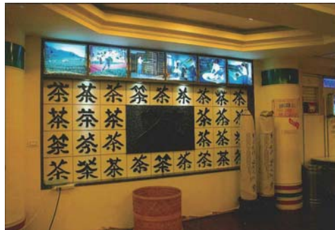
▲店内のレイアウト