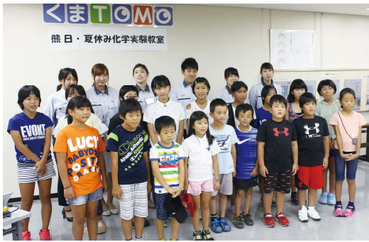
▲参加した子どもたち

熊日・夏休み化学実験教室 新聞のインクを 通じて 化学の力を学ぶ 新聞のインクはどうやって作るの？ 講師のD.I.Cグラフィックスの担当者が「色の仕組み」や「印刷の仕組み」を説明すると、「くまTOMOサポーター」の小学生達は熱心にメモを取っていた。実験では、鉄くぎを塩酸で溶かした溶液に過酸化水素水を入れ、さらに「魔法の水」を入れるとす