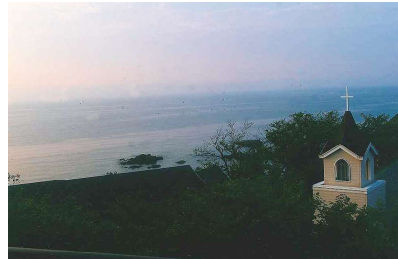
▲朝5時。こんなに明るい！

ツブダウンが多 く、海に 浮かんだ 大きな島 と言って もよく、 兵庫県の 淡路島よ りも大き な島で、 島めぐり をするとな ると、たつ ぷり8〜10 時間かか り、一泊の 旅ではま わりきれ ない。海 の幸、山 の幸にめ