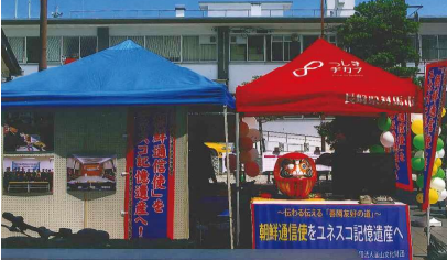
▲対馬の祭り(韓国祭り)〈4枚とも〉