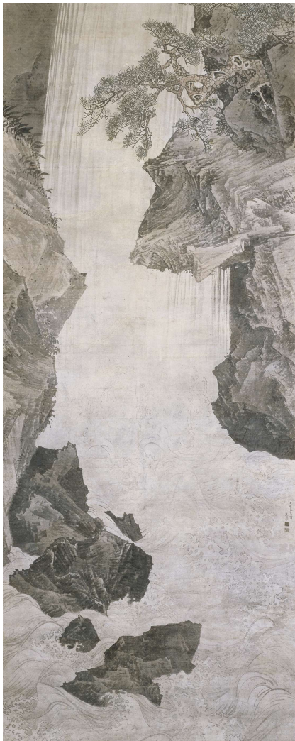
▲円山応挙筆「大瀑布図」 安永元年(1772年) 相国寺所蔵

財)、大う「三次元」表現に、当時、応挙作「大瀑布」がチャレンジした作品です」と話