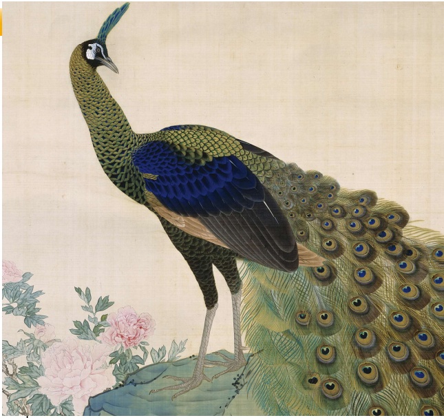
▲円山応挙筆「牡丹孔雀図」(部分) 国指定重要文化財 明和8年(1771年) 相国寺所蔵 黒と青を重ねて彩色する技法、羽毛のふわふわとした質感、孔雀が今にも本当に動き出しそうだ

財)、大う「三次元」表現に、当時、応挙作「大瀑布」がチャレンジした作品です」と話