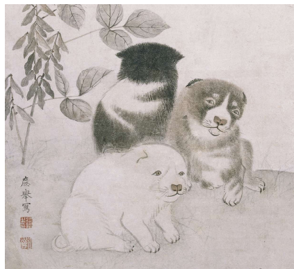
▲円山応挙筆「豆狗子図」(部分) 江戸時代中期(18世紀) 鹿苑寺所蔵 狗(いぬ)を主題に描いたのは、円山応挙が最初といわれる。まるまる、ころころ、ふわふわとした子犬の様子は、観る人が思わず笑顔になる。応挙は、無類の「大好き」だった！

「大瀑布」がチャレンジした作品です」と話す。また市博では「偽物」が多い事である有名な応挙ですが、やって来たのは、無料で楽しめるそう。