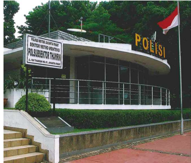
▲インドネシア版「交番」

層ビルもかなり建っているが、まだ工事中。立派なビルの周りの歩道も整備されているとは言え、粗末なもので、狭くなったり広がったり、舗装はところどころはがれてい