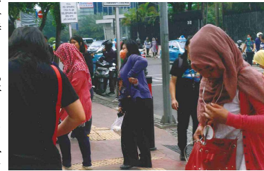
▲ひと目でイスラム教徒とわかる女性

店の中は人がパラパラ、店員は手持ち無沙汰そう。教徒のほとんどは店員も含めて頭から顔にかけてスカートの布で被っており、濃淡はあるが、教徒が多いことがわかる。