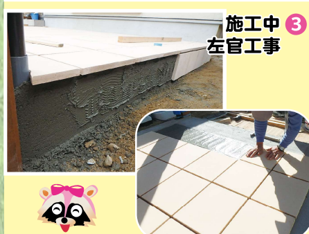
3 施工中 左官工事