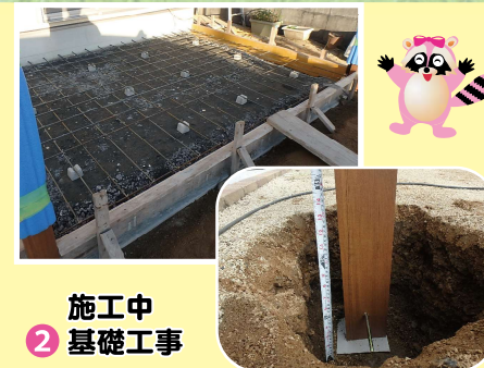
2 施工中 基礎工事